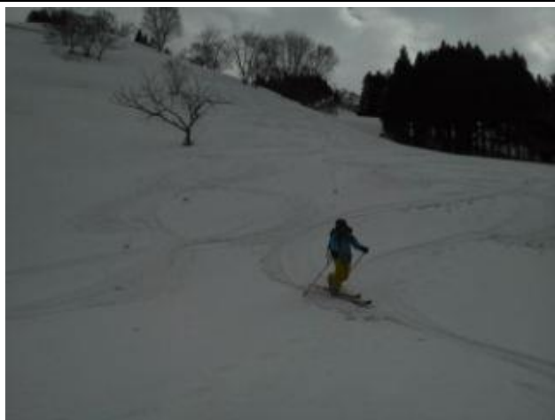
07 華麗なテレターン