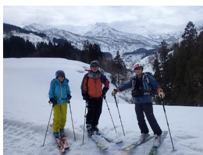
09 林道に戻り満面の笑顔