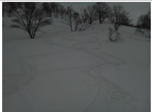
06 ザラメ滑走のシュプール