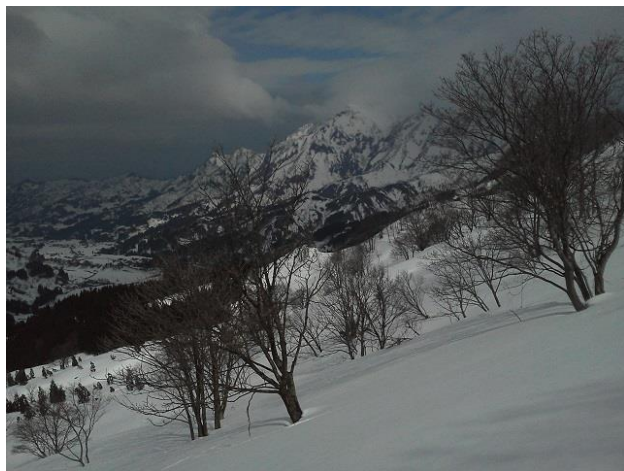
03 鉾ヶ岳・権現山を振り返る