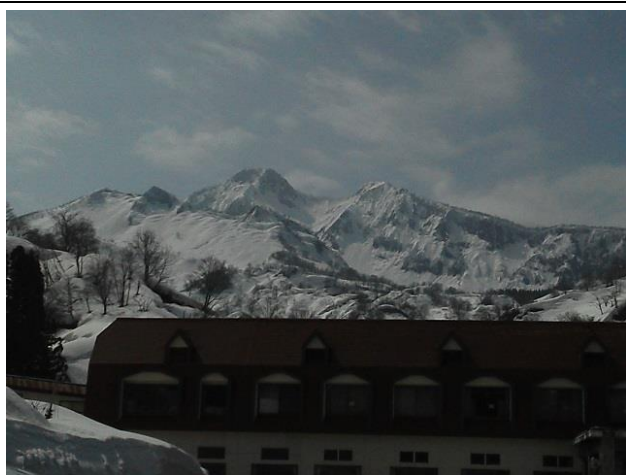
11 妙高山似の烏帽子岳を望む焼山温泉