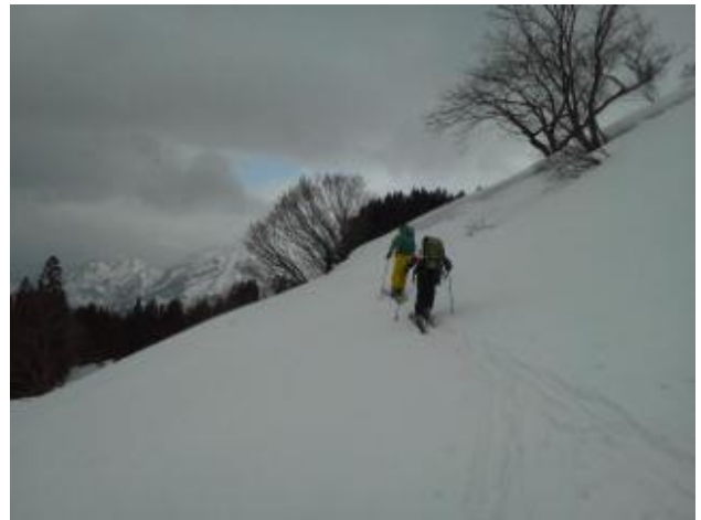
02 急斜面のトラバース登高