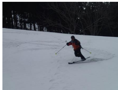
08 バランステレターン