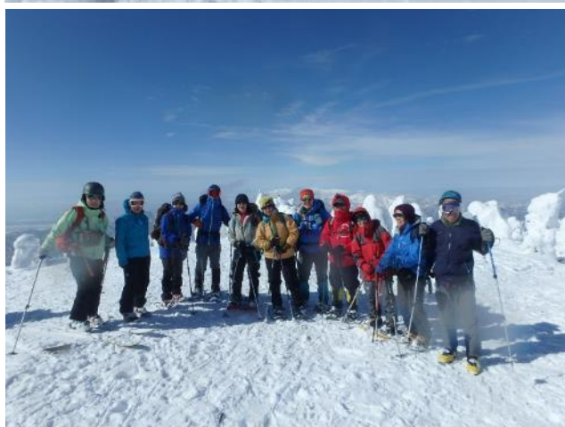
西大巔山頂で全員集合の記念写真