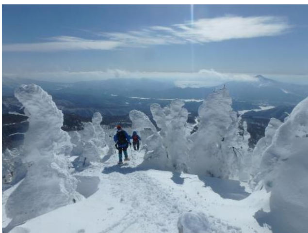
モンスター群のなかを縫って下山