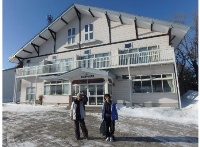
宿はロッジ シュガーハウス