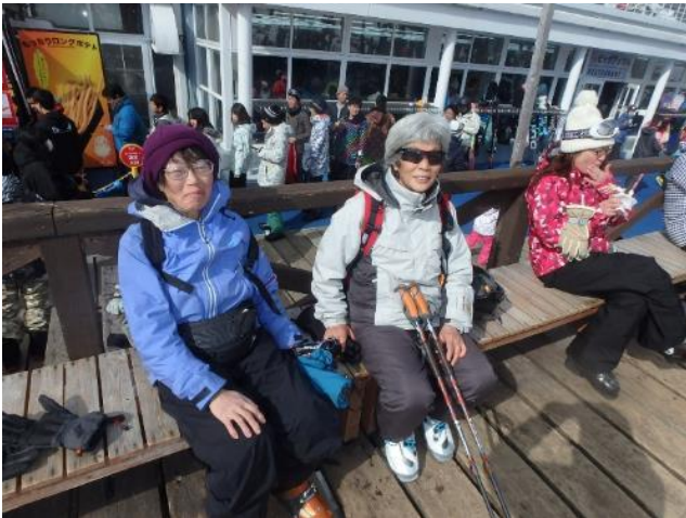
レストハウスは大混雑なので外で休憩

午後は天気はよいのだがゲレンデ上部は強風で目も開けていられないほど。スピードを落として運行するリフトもあったりしてちょっと大変だった。全体としては9時スタート、途中2回の休憩を入れて午後3時まで滑ってからたかつえスキー場下の民宿（ロッジ シュガーハウス）に向かった。広い部屋と快適なお風呂で大満足！1泊2食とたかつえスキー場の1日券付で8,500円は超お得です。