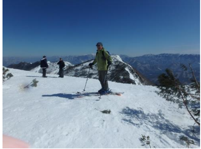
背後は七ヶ岳の最高点