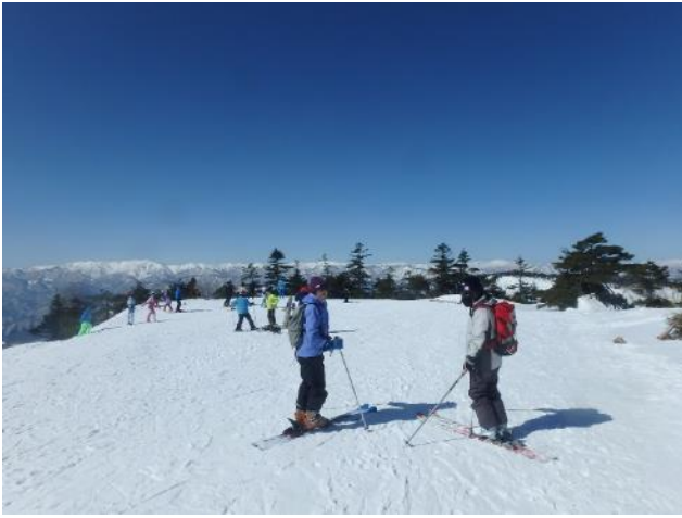
リフトトップの広場（正面は会津駒方面）