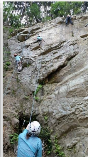
午後はみんなガンガン登って楽しむ♪

今回の参加者で初級者は二人だけだったので、手取り足取りで講習が出来たのではないかなと思う。参加者はとてもラッキーだった。昼食後は、5.9から11くらいのルートをローテーションで登った。一日を通して6-7本くらいは登ることができた。 初級者二人の登りは朝と午後では明らかに進化していた。とても良い講習会だった。お疲れ様でした。