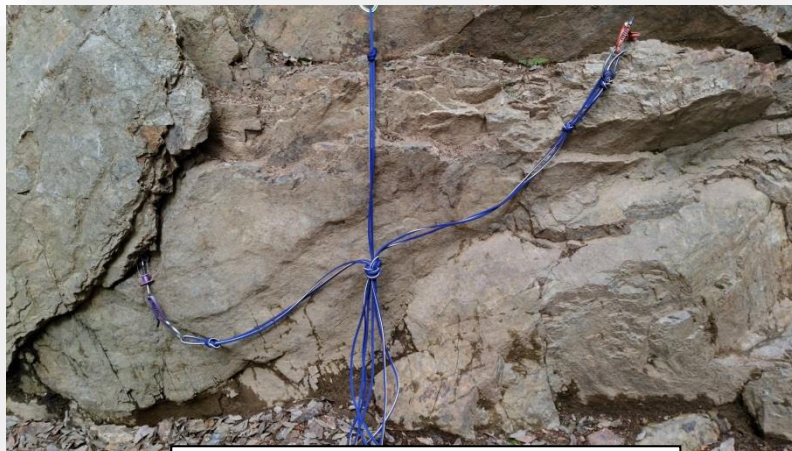
流動分散と固定分散のミックス。 本来の角度は 120^\circ くらいで。