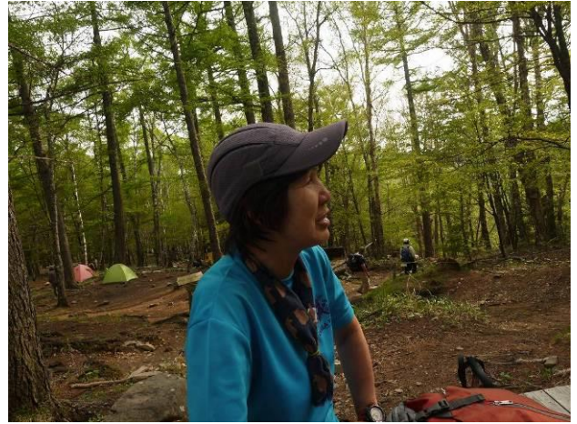
(富士見平小屋休憩風景)