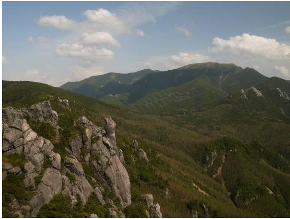
(瑞牆山から金峰山)