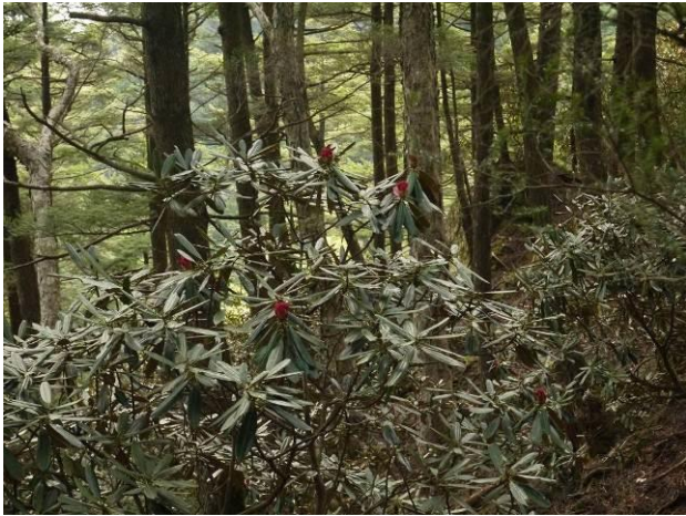
(登山道：富士見平小屋付近しゃくなげ)