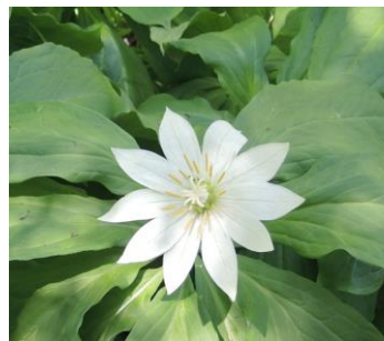
キヌガサソウ:知ってますか 花びらと葉の数は同じです