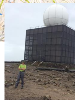
②車山山頂で雨がやむ