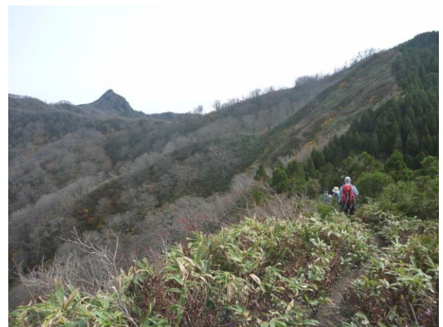
冠山が姿を見せれば冠山峠も間近

金草岳が登り下り合わせて4時間、冠山が3時間余り、両方の山合わせて7時間余り、よく歩いた一日であった。天気にも恵まれ、気持ちよく歩け、良い山行となった。今日もまた道の駅 星のふるりの温泉で汗を流し、そこでテント泊。