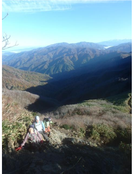
ロープの岩場を登る（後方は荒島岳）