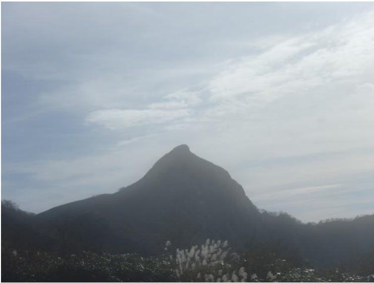
奥美濃のマッターホルン冠山