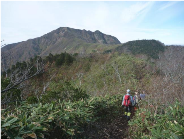
手前が桧尾峠、後方が金草岳の前衛ピーク

冠峠から先ずは桧尾峠を目指す。最初、山の腹をまいている様で、平坦な道が続き、その後、水場の入り口まで、ぐっと下った。下りきってから桧尾峠まで急な登りであった。そこからアップダウンを繰り返し、稜線歩きとなる。稜線では先程登った冠山の烏帽子の形をしたカッコ良い山の形、遠く白山等々の山が見えたり、ツルリンドウの花が1輪咲いていたり、その花の赤い実、コケモモの赤い実、つつじやもみじの紅葉などに元気ももらえた。