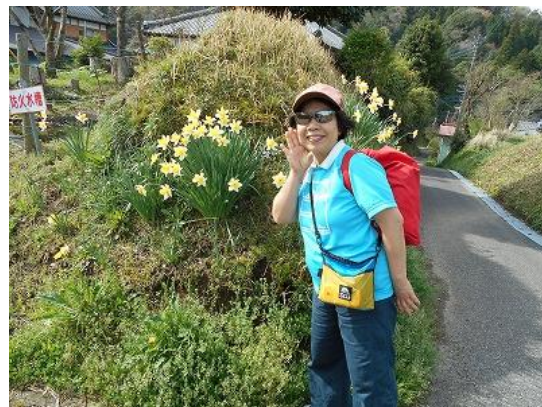
花いっぱいの二人旅。