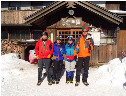
黒百合ヒュッテで大～休止