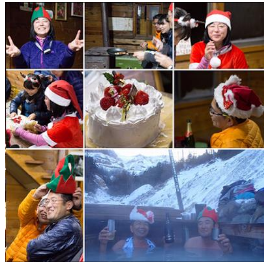
小屋でクリスマスを楽しめる面々