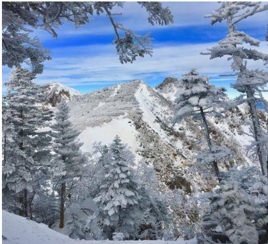
青空が見え始める