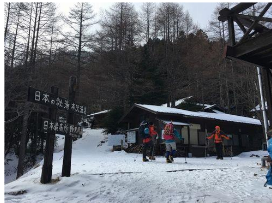
あっという間に到着