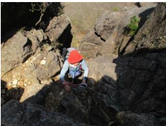
(放送) 赤組さんリードしてます～