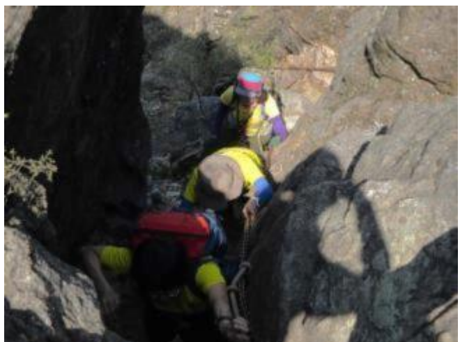
(放送) 黄色組さん頑張ってください～