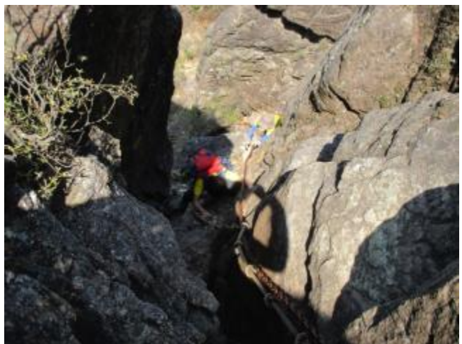
まだまだ鎖場です