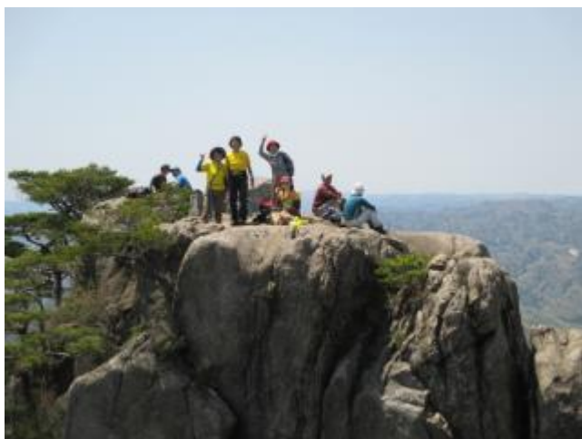
↓ 景色抜群の男体山 山頂です。 女体山山頂 (12:10)