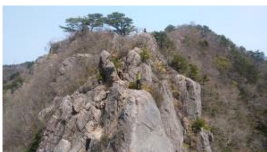
男体山から見た女体山です (堀田を探せ～)