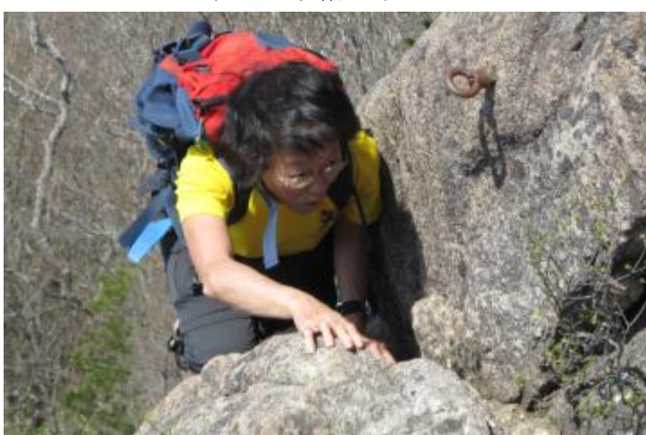
アンカー パワフルです～