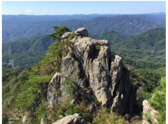
この岩峰に登ります 左=男体山、右=女体山