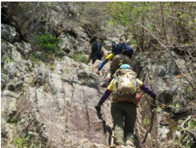
結構長い鎖場が続きます