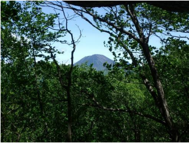
樹間から望む男体山