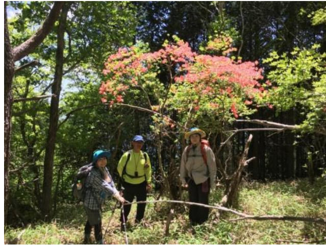
山ツツジは今が満開