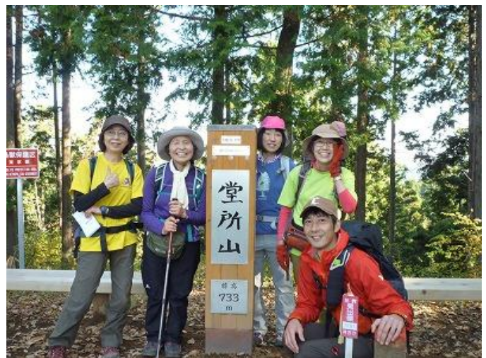
景信山・堂所山・明王峠を通過します。