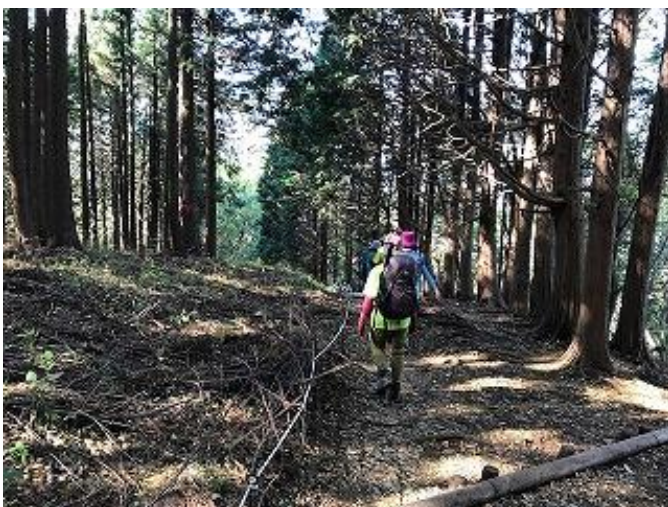
裏高尾縦走路は静かな道のりで～す 皆さん元気に歩みを進めま～す 皆さん元気によくしゃべりま～す(´・ω・`)ゞ

ご一緒させて頂いた皆様に「漬物」・「モナカ」・「みかん」・「チョコ」・「バナナ」・「ミカン1房・・・」etc・・・を戴き、元気満々・お腹パンパン・・・皆様の「女子力」の高さに感動しました。おいしかったです。けれどここは最初の通過点に過ぎません！ここからが本番です。次なる目標は景信山（727m）を通り、目的地 陣馬山を目指します。