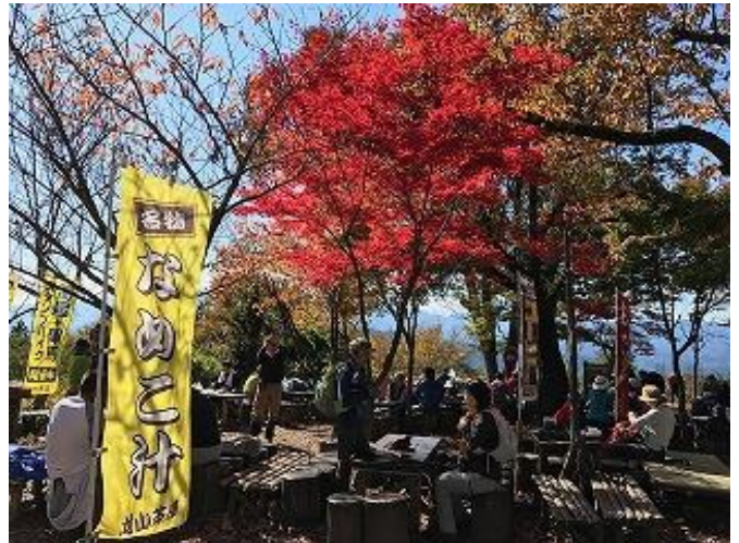
ヤマモミジも既に紅葉していました。 「なめこ汁」美味しいです。

元々関東一円に人気のあった高尾山ですが、ミシュランガイドに掲載されてから、以前に増して観光化が進み、土地ならではの「食」も爆発的に増えたそうです。なんか色々商売してはりました・・・