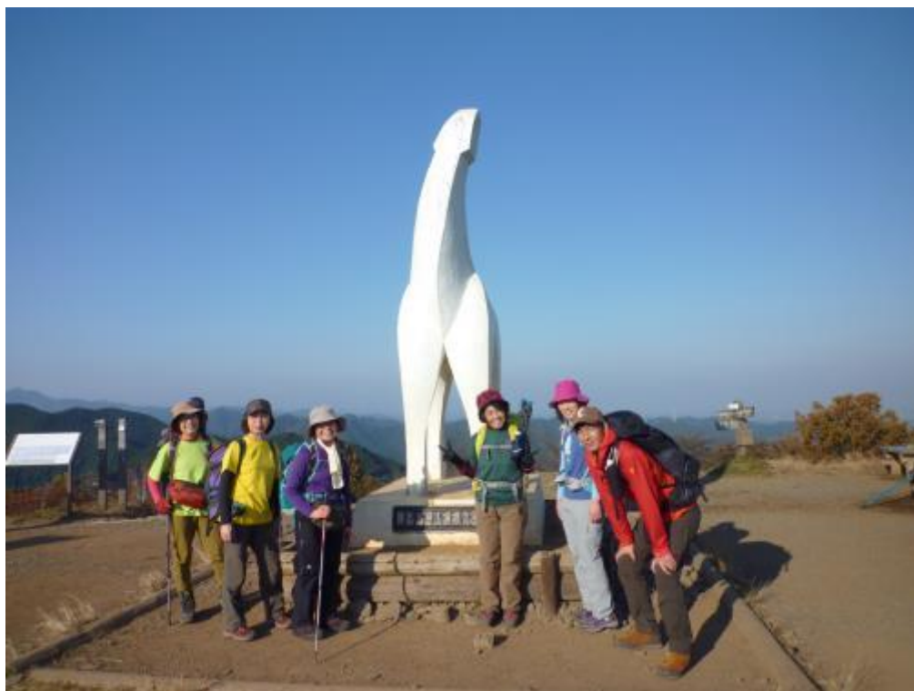
陣馬山（陣場山）山頂到着 14：40 白馬が青い空に映えますね。

休日という事もありハイカーも多く、また決してアップダウンの激しい縦走路ではありませんが歩行距離が意外と長いのでそれなりの体力が必要です。皆さん元気に陣馬山を目指します。