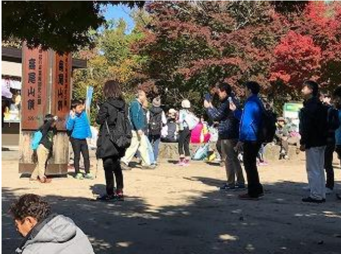
高尾山頂はとても賑やかですね。 記念写真待ちの行列・・・