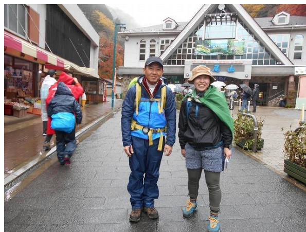
ケーブルカー清滝駅

午前10時半、ケーブルカー清滝駅横6号路から入山。足場は多少岩がでていものの良かった。