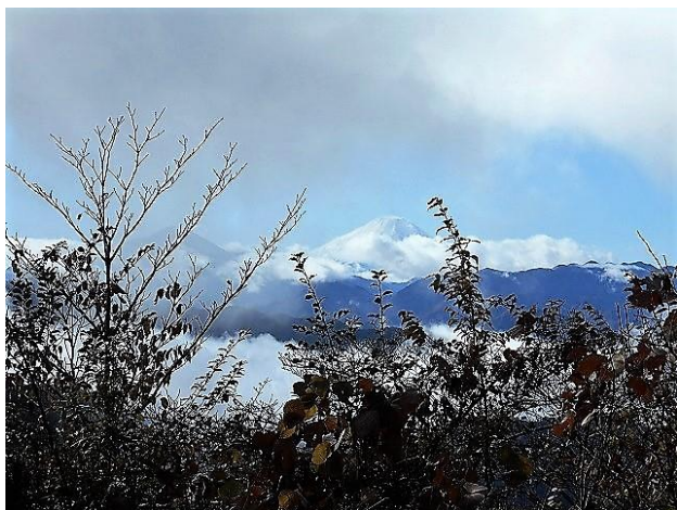
山頂からの富士山