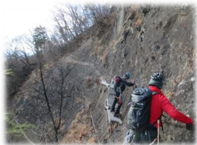
赤岩下部のトラバース（裏妙義）

2日目＝表妙義 中之獄神社駐車場（7：30）－中ノ岳（9：00）－東岳（10：20）－エスケープ―第四石門（11：40）－石門入口－中之獄神社駐車場（13：10）