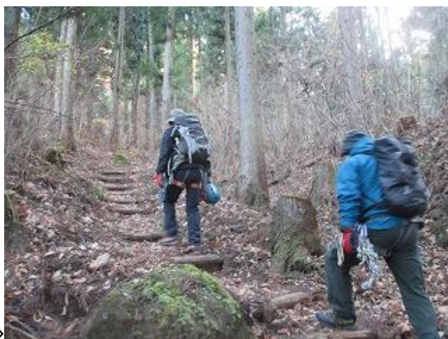
籠沢 登山口より籠沢のコルを目指します 籠沢こもりさわコース