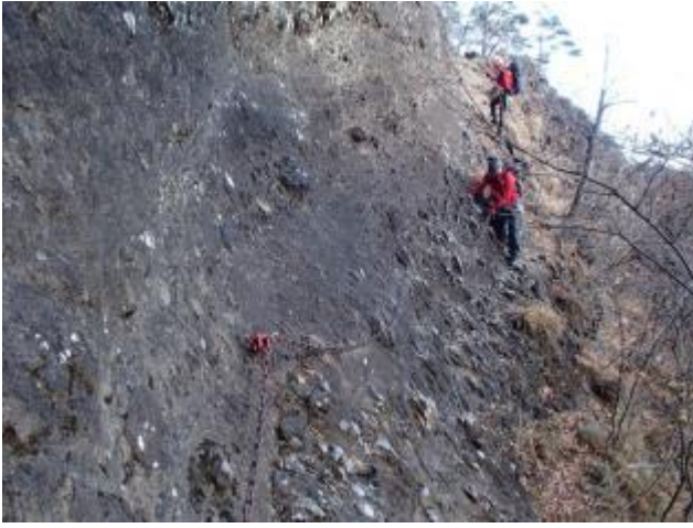
カラビナを掛け換えながら、 丁須の頭下部・赤岩下をトラバース