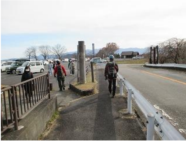
中之獄神社駐車場 山行終了 (13:10)