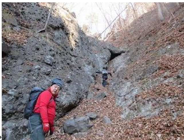
籠沢のコルに到着です