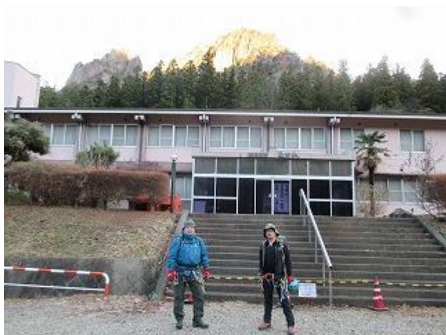
前泊地であり昨年閉鎖された「国民宿舎裏妙義」駐車場を出発（6：50）