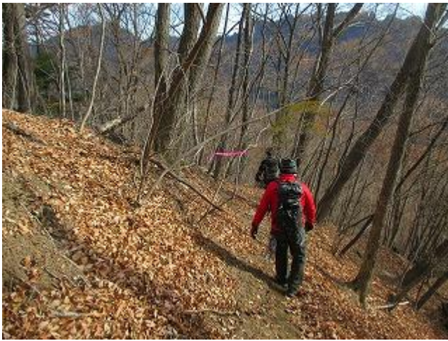
三方境を通過し、女道で下山します。