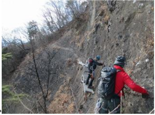
ゼネコンの監督が見たら、 卒倒しそうな足場ですね・・・