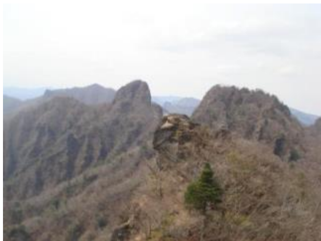
赤岩 (右) の絶壁下へ向かいます

丁須の頭 到着 (9:30) 大勢の人がいます。人気者！ 鎖が見えますが誰もものぼりません～