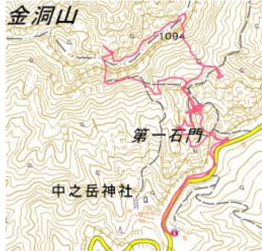
活動距離 = 3.25 km