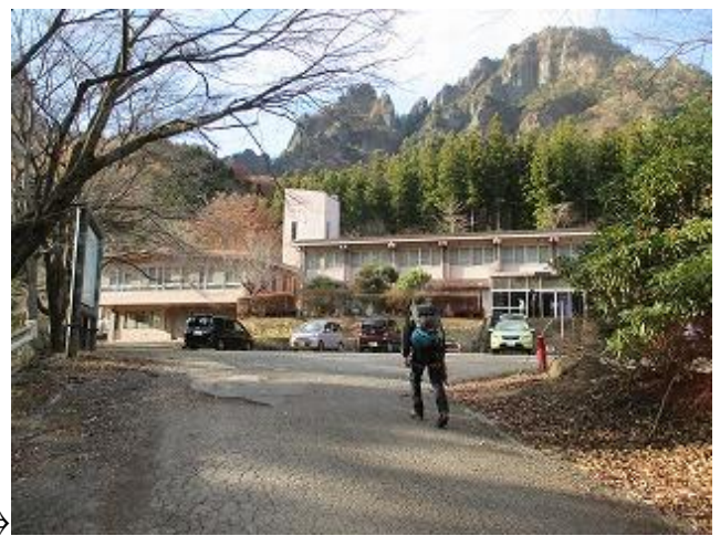
国民宿舎裏妙義到着 周遊完了 (14:50)

緊張感がありスリリングな裏妙義、標高の低い場所では紅葉も楽しみ また落葉の中をサクサクと気持ち良くハイクする事もでき「山の魅力」を満喫した1日目でした。