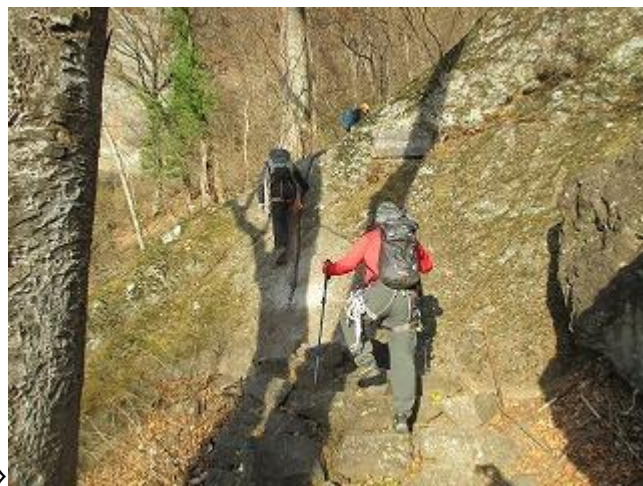
中之獄神社駐車場で準備を整え山行スタート（7：30）