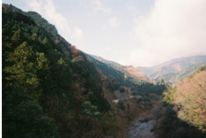
万世橋より(多摩川)