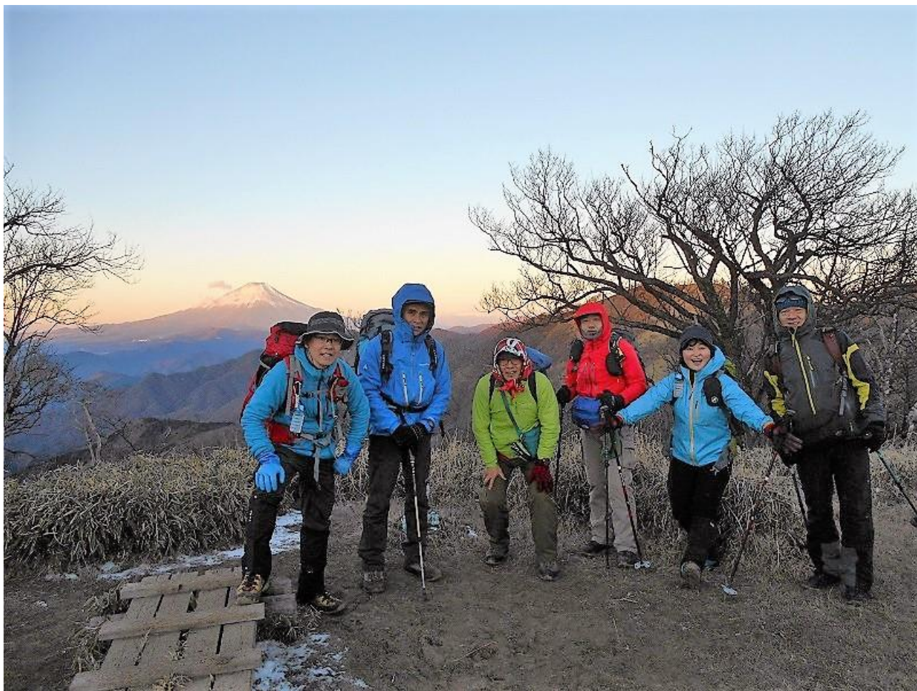
【快晴の丹沢山山頂での記念写真】