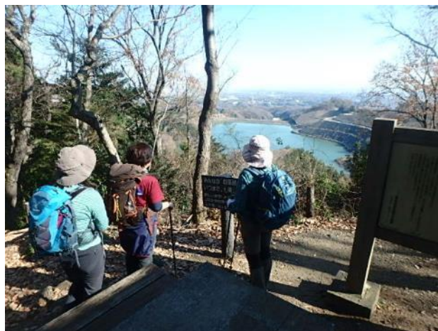
草戸山から城山湖を眺める

榎窪山からは展望は得られなかった。三沢峠は広々としていた。泰光寺山、西山峠を越えて行くと、突然視界が広がる見晴らし台にでた。ベンチいっぱいの人に座っていた。津久井湖の向こうに、石老山、丹沢山塊、上野原の山々を見渡せた。