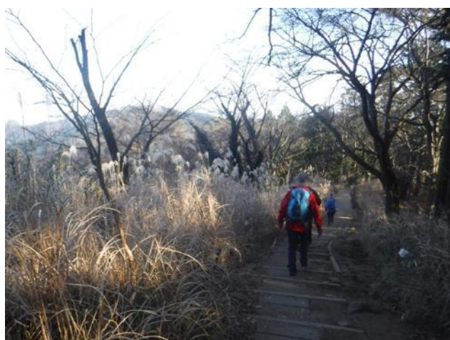
左前方に目指す高尾山を見ながら