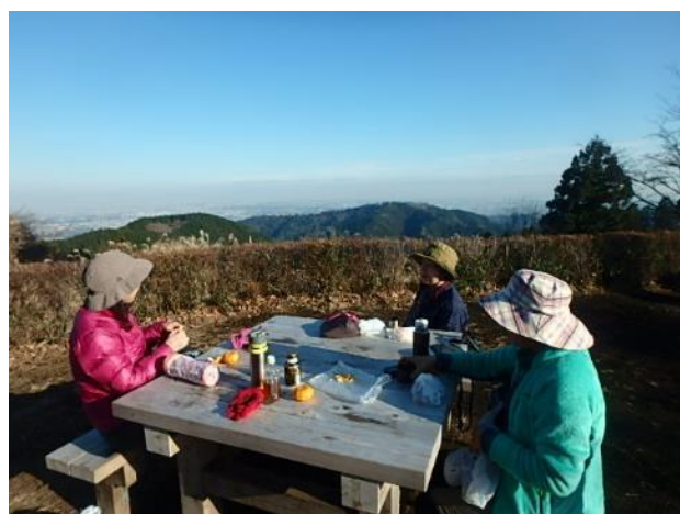
山頂から都心部を見渡す

この先は高尾山主脈の縦走路だ。道も広く歩きやすかった。一丁平からは富士山、丹沢山塊が見渡せた。もみじ台を過ぎ、高尾山頂は巻いて、賑やかな薬王院のコースをとった。高尾山駅からケーブルカーで清滝まで下山し、京王高尾山駅で電車に乗った。