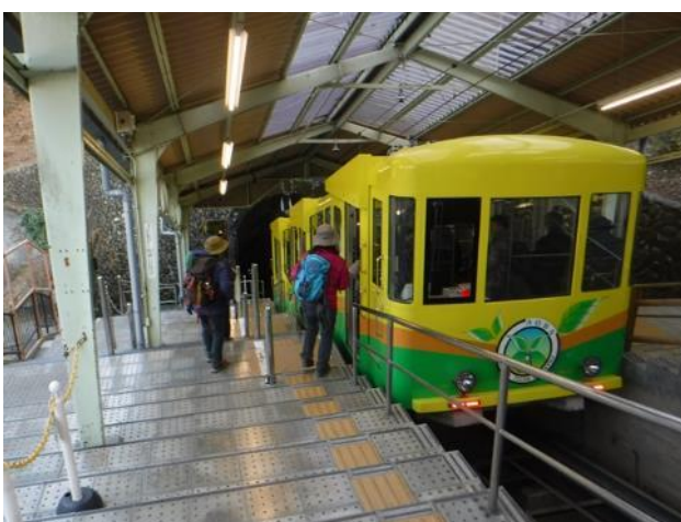
高尾山駅からケーブルカーに乗る