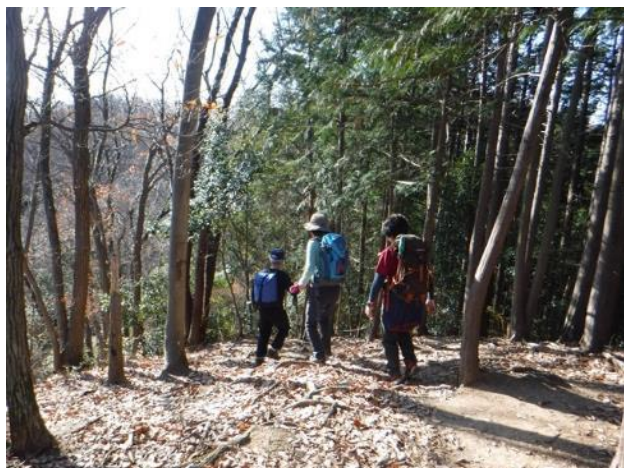
明るく気持ちの良い稜線

榎窪山からは展望は得られなかった。三沢峠は広々としていた。泰光寺山、西山峠を越えて行くと、突然視界が広がる見晴らし台にでた。ベンチいっぱいの人に座っていた。津久井湖の向こうに、石老山、丹沢山塊、上野原の山々を見渡せた。