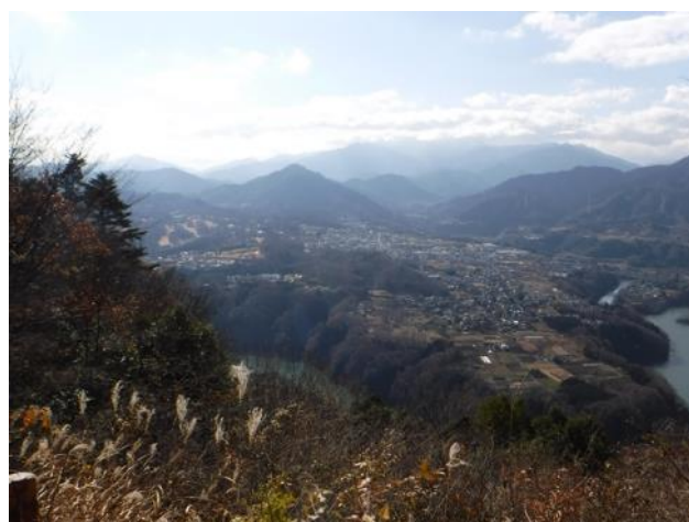
見晴らし台からの景色

中沢峠、金毘羅山を越えていくと大洞山だ。高尾山、相模湖リゾートの観覧車が見えた。