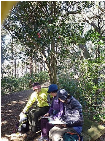
鷹取山 10:35 (休憩)