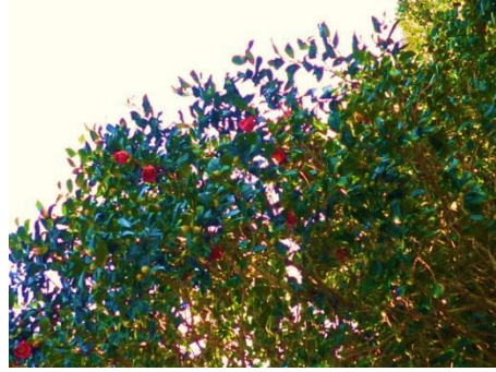
御殿山 10:10 陽光にキラキラ光る太平洋が見えました。ここから椿の回廊。