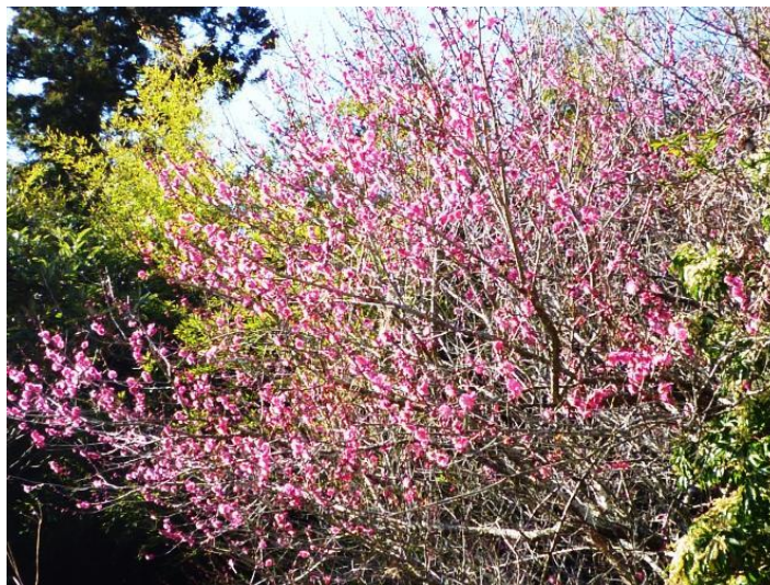
登山道に向かう途中 梅・ロウバイ・水仙が満開。いい香りがプ〜ン ♡。