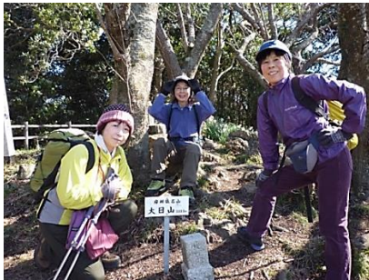
大日山 11:20 太平洋と東京湾が見えます。(風が強いです。)