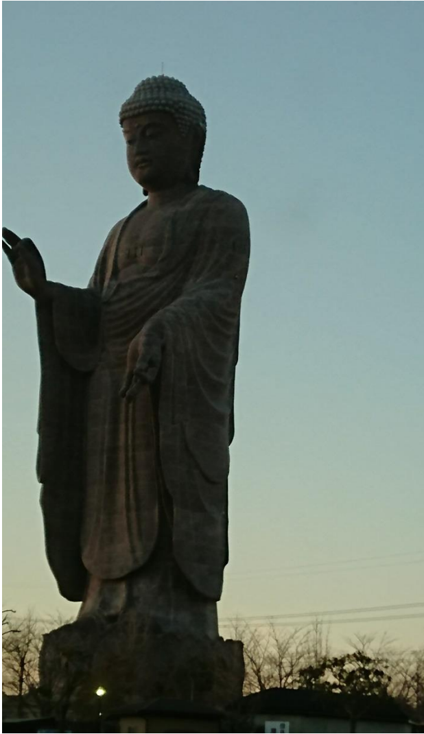
途中で見た牛久の観音様。