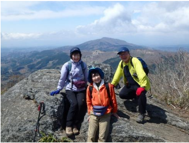
鎌倉岳山頂記念写真