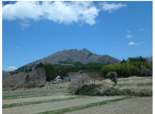
帰路から見上げる鎌倉岳