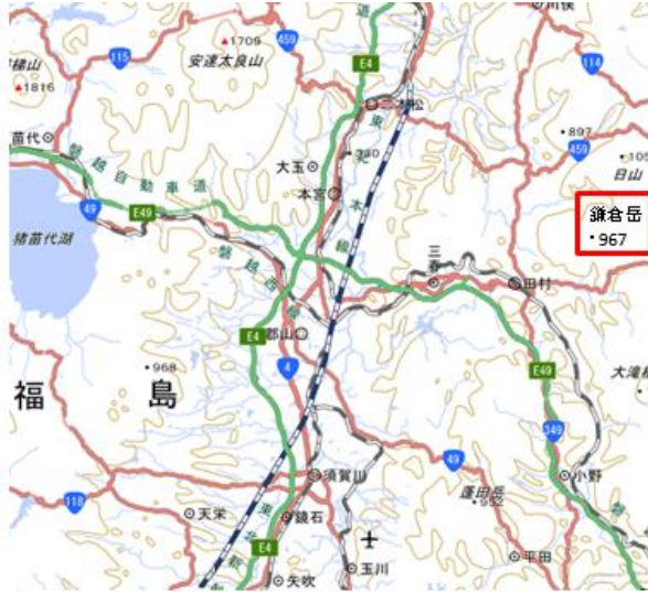
鎌倉岳は郡山の東方

松戸 6:00⇒(常磐道～磐越道経由) 小野 I C⇒中野区少年自然の家駐車場 10:05- 鯨沢コース 750m 10:45- 鎌倉岳山頂 11:15- 石切場 11:50- (萩平コース経由) 自然の家駐車場 13:18 ⇒船引三春 I C⇒(磐越道経由) 猪苗代磐梯高原 I C⇒リゾートイン四季(泊)