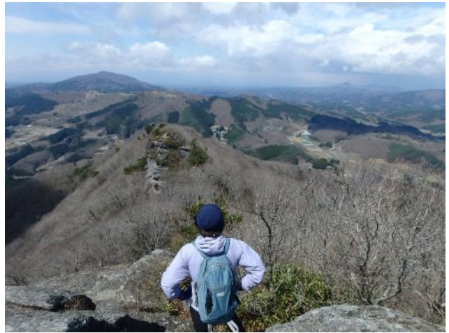
広大な阿武隈山地（左後方は移ヶ岳）