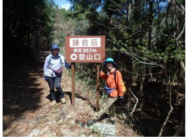
萩平コース登山口