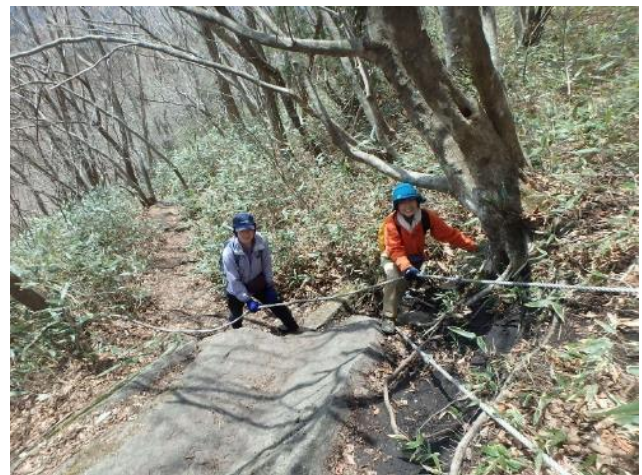
山頂へ向かうロープ場