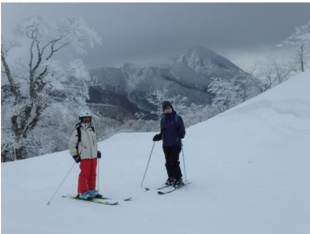
磐梯山をバックに