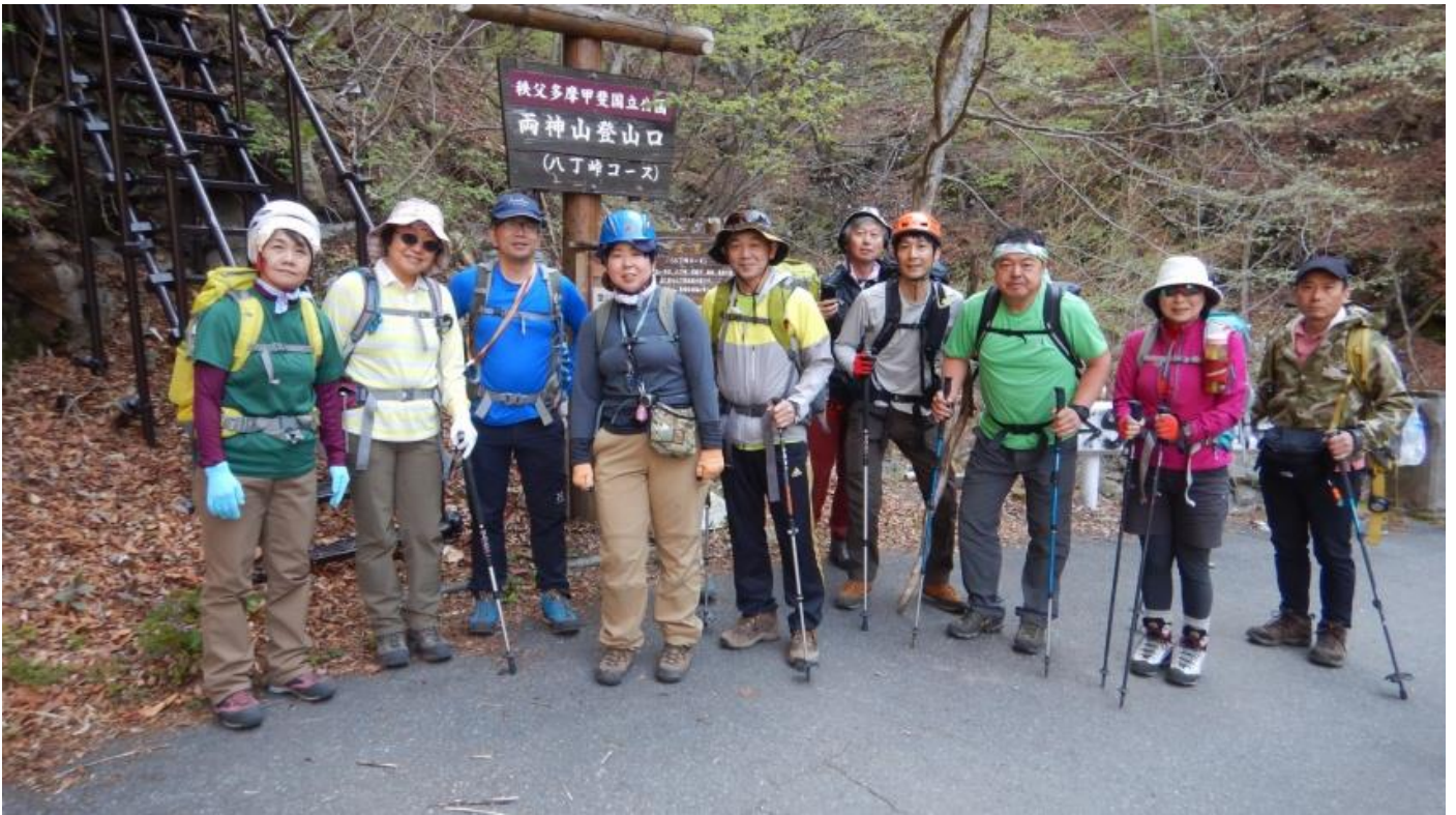
上落合駐車場 登山口