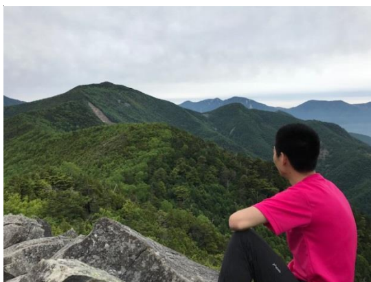
これから進む縦走路

これから進む縦走路を見つめていたCLより「もう満足しちゃった。この先の樹林帯を考えるとちょっと憂鬱なので下山しない？天気も崩れるしね・・・」との素敵なお提案。