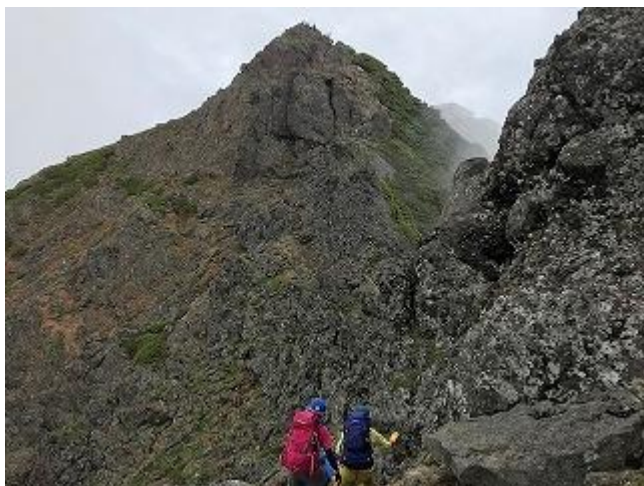
赤岳を目指します