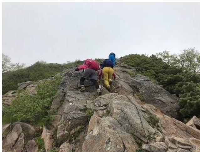
けっこう多いです