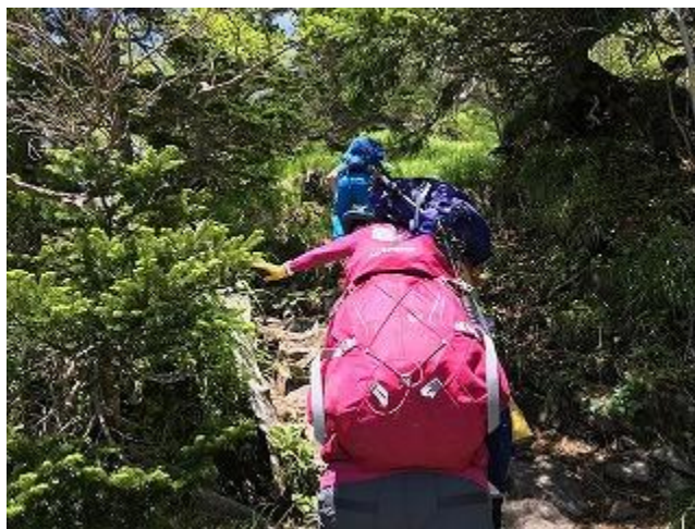
展望の無い道を進みます。

牛首山を過ぎるといよいよ真教寺尾根を進みます。牛首山の先は平坦な道が暫く続き終盤から一気に斜度がきつくなり、鎖場が現れます。