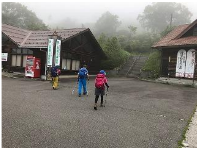
たかね荘駐車場を出発