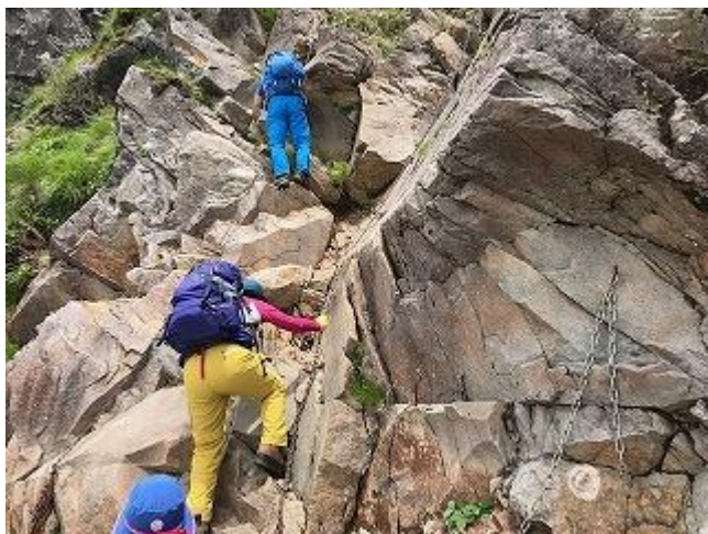
鎖・鎖・よじ・よじ

掴みやすいところが多く、岩も乾いていたので不安を感じる様な所はありませんが、下りで利用されている方も多いため落石やすれ違いには要注意でした。