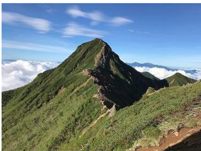
梯子は大渋滞！でも景色は最高！