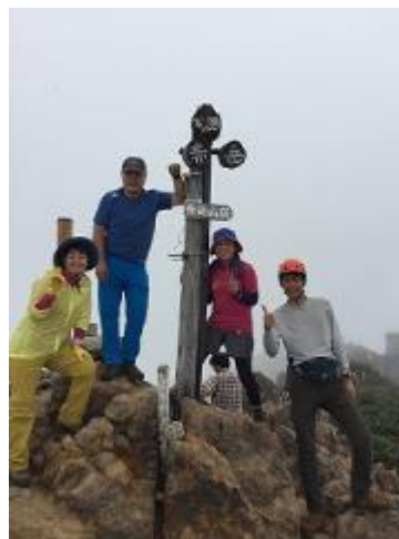
とても賑やかな山頂(12:30)でした

◎赤岳展望荘 噂の五右衛門風呂・・・想像以上に立派で5人くらいは入浴出来る大きなお釜でした。こんな稜線上で風呂を沸かしてしまうとは見習うべき企業努力・・・もちろん石鹸を使用する事は出来ませんが、排水を浄化槽のバイオ微生物の培養液として利用しているそうです。