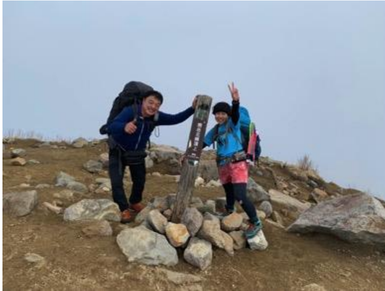
焼岳は北峰と南峰があります