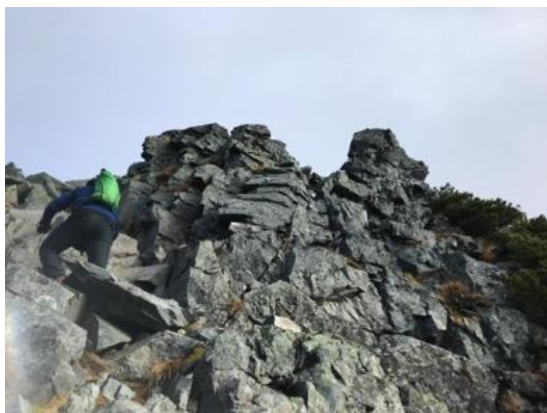
夜中はたくさんの雨？ひょう？が降ったよう