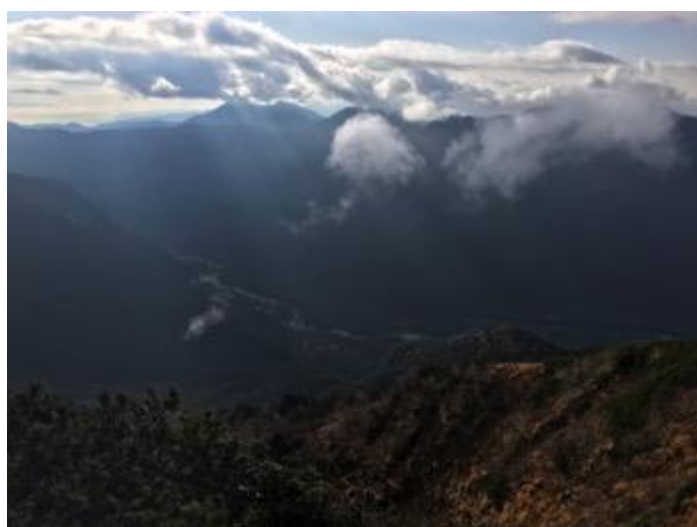
上高地を上から見るのははじめて