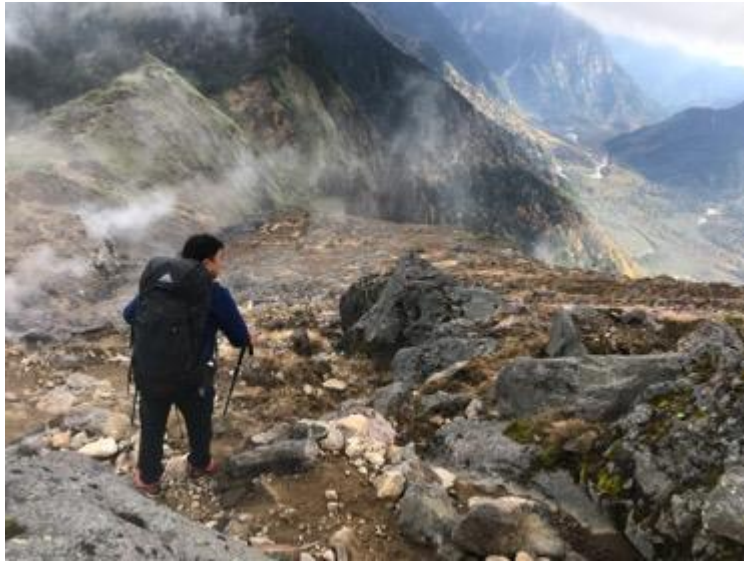
西穂山荘を目指します