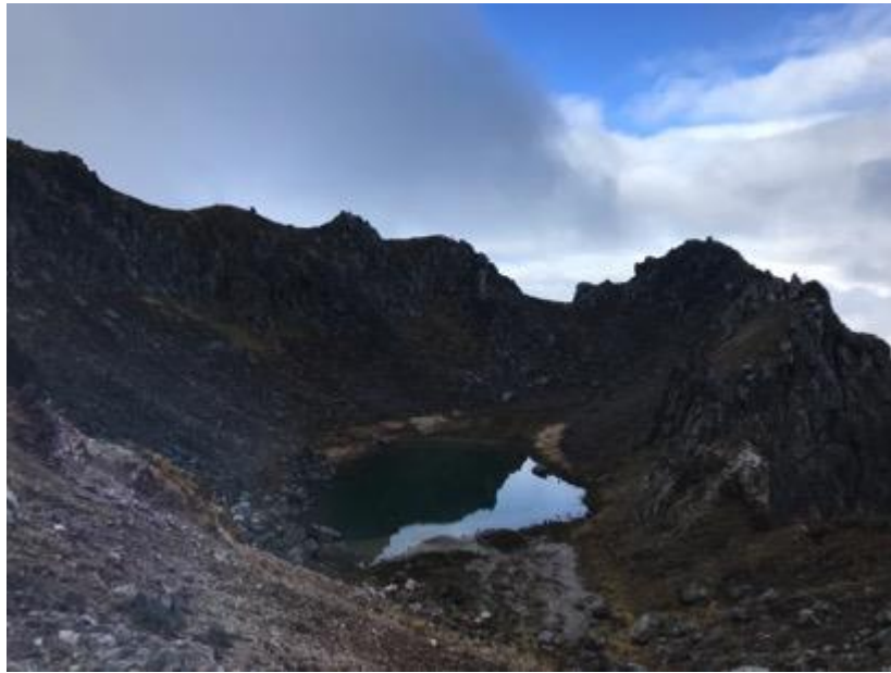
焼岳は大正時代に噴火し