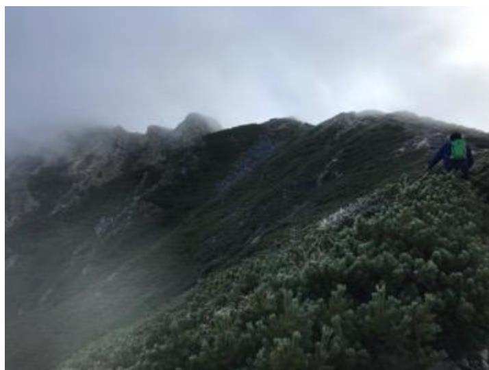
岩や植物にはさらさらの雪のようなものが乗っていました