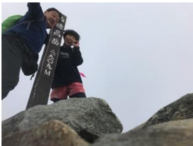
西ホー♪キノさんありがとう