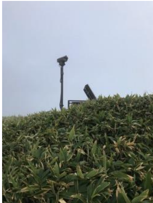
焼岳をいつも観察しているよう 火山ならでは！