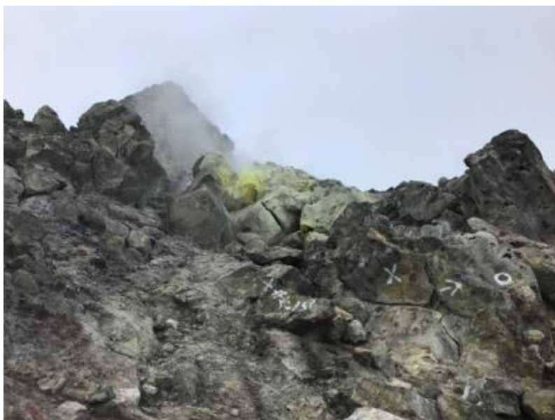
いろいろなところからもくもく