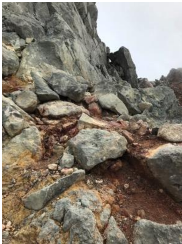
まるで絵具を まき散らしたみたい