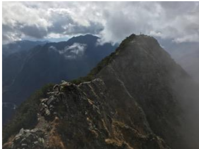
いつか槍まで行ってみたい