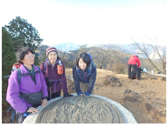
奥多摩の山並みをバックに