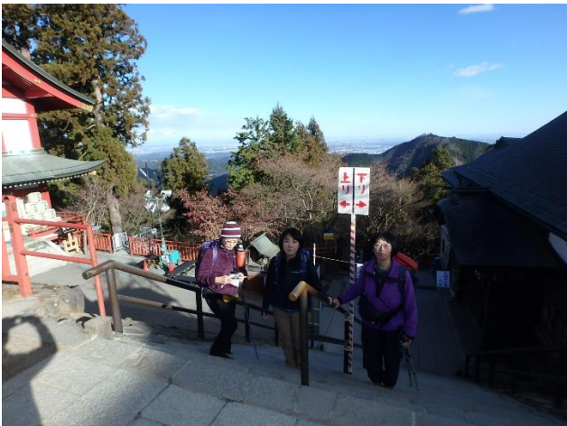
御岳神社の初詣準備も万端