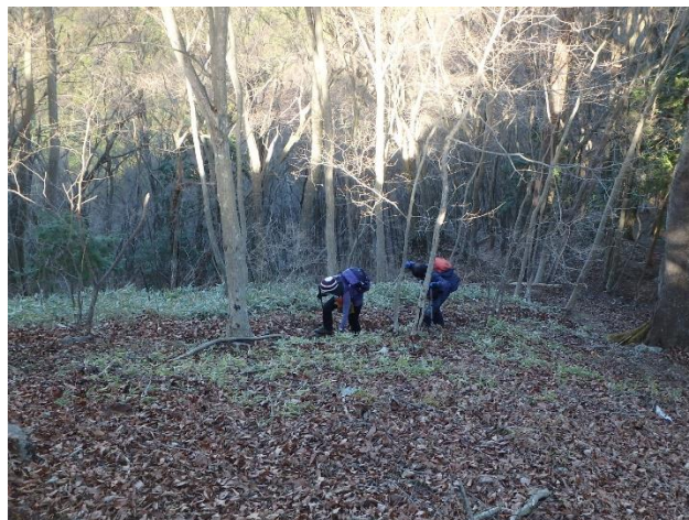
日の出山山頂直下の急登