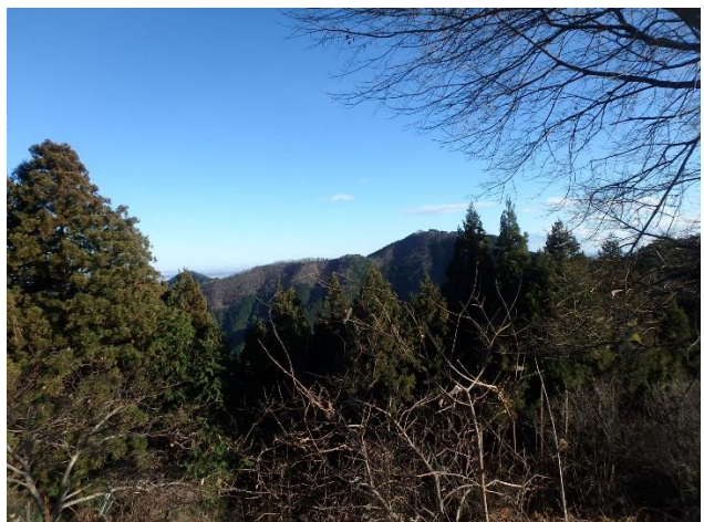
ロープウェイ駅付近から登ってきた北尾根

満腹を抱え御岳神社に向かう。ほぼ平らな山道を行くと宿坊街となり宿泊客や御岳山の参拝者とすれ違う。御岳神社を参拝し、ケーブルカーとバスにて御岳駅より帰路についた。