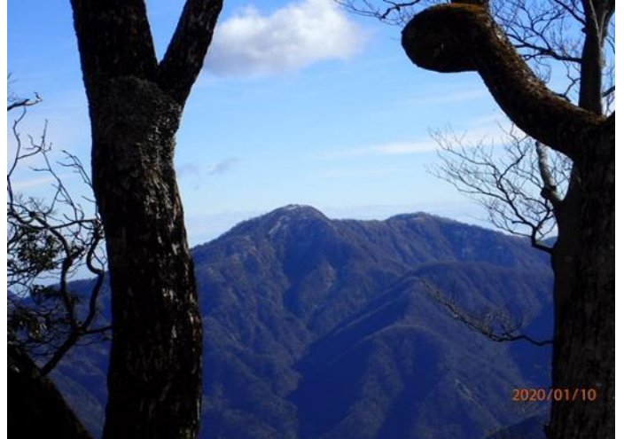
大室山の山頂付近よりの蛭ヶ岳

年初めの山行としては、地味なルートであったが、富士山はよく見え、平日の為か出会った登山者は2人だけで、静かな山を楽しめた。