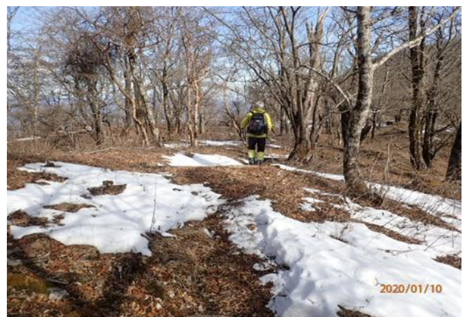
加入道山の少し手前の道 大室山までずっと所々に雪があった。