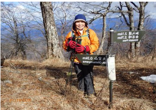
加入道山頂上にて