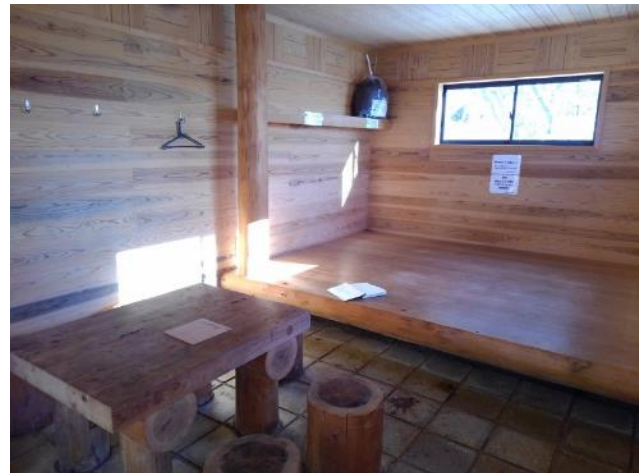
加入道避難小屋の内部