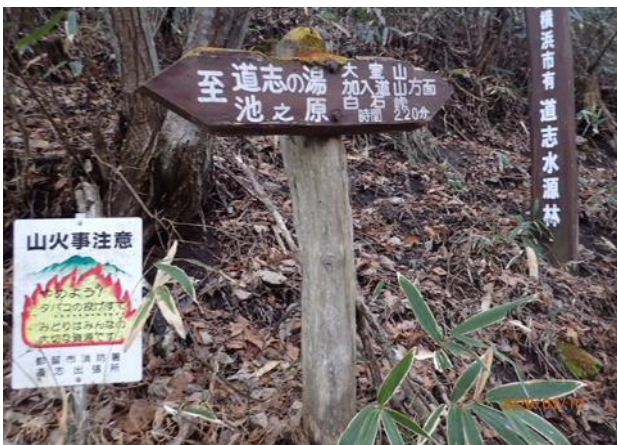
道志村の室久保登山口

昨年11月の台風、大雨により西丹沢の用木沢からの登山道等が通行不可能なので、反対側の道志村の室久保登山口からのコースで、日帰りで行ってきた。