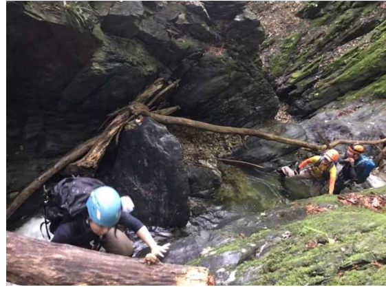
トポ⑥のチョックウッド滝