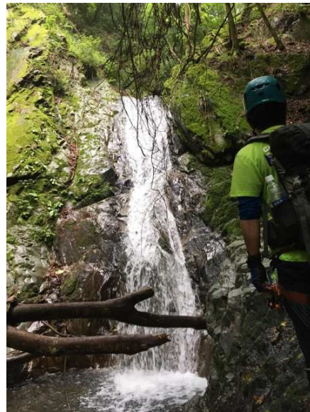
トポ⑧最後の 10m 滝も、もちろん巻いちゃう

廻行図では藪漕ぎなしで登山道へ出るはずでしたが、分岐を間違えたようで、急斜面に足をすべらせながら直登。沢登りらしい詰めに満足して登山道へ出た時にはぐったりでした。出たところは、軍刀利神社の横。開けたところで海保さんが持ってきてくれたバウルー（ホットサンドメーカー）に持ち寄ったチーズ・ハム・ドライトマト・ゆで卵・セブンプレミアムの金のハンバーグなどを挟む。ホットサンド 1 超おいしいです。元気を取り戻して、下山開始。長尾尾根はその名の通り、なかなか終わらない。しっかりした道でしたが、最後の下りだけ道なき急斜面を滑り落ちて沢まで降り、沢を渡って林道へ出ると、