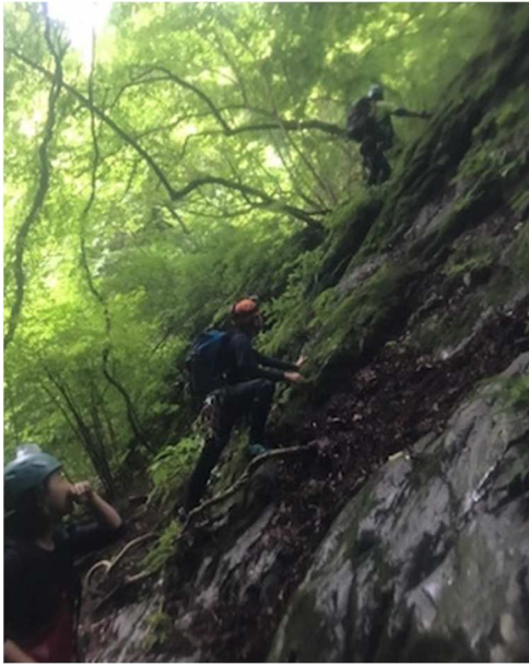
トポ⑤の大滝はもちろん巻く