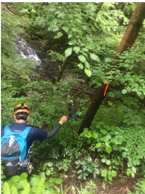
林道からやや下って入渓

その後もたくさんの小滝を登ったり、高巻いたり。途中の河原で休憩中にハーケンを打つ練習をしたりしながら（適当ナリスが無くまったく成功せず）、詰めへ。