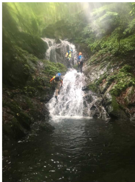
トポ②の 3x4m+2 条 4m