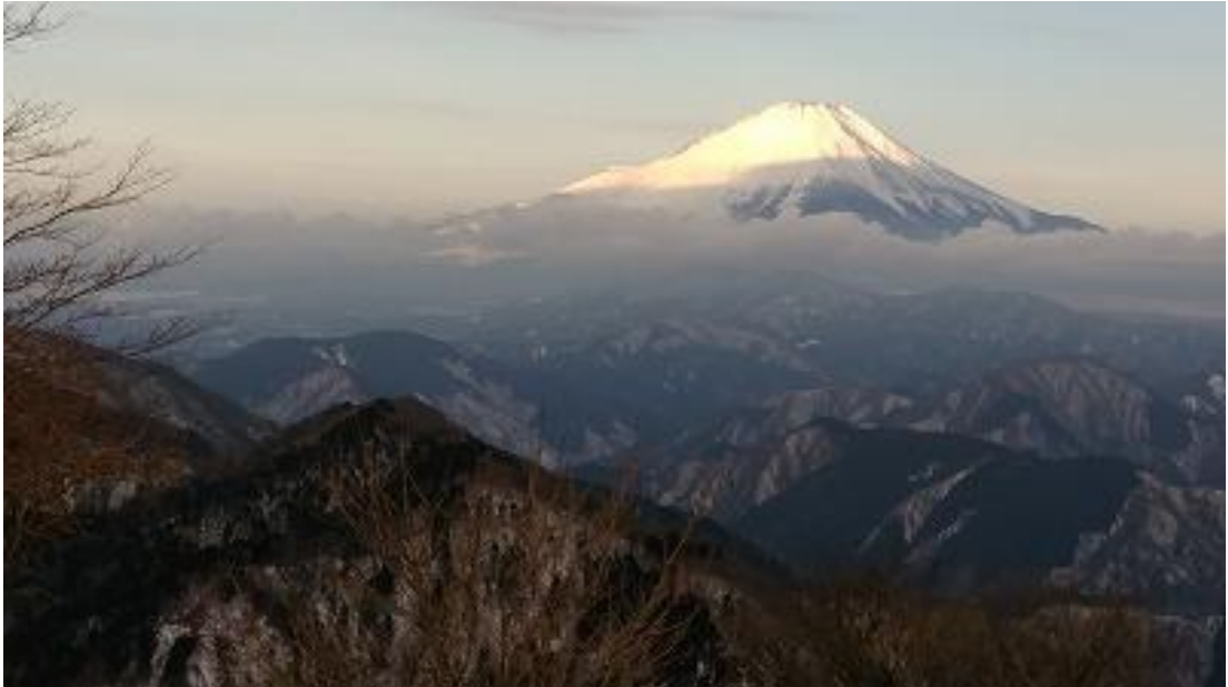
上【朝焼けの富士山】 中【雪の鍋割山荘】 下【朝焼けの相模湾】

28日 5:00に起床して4人分の朝食を作り、一つのテーブルでお客とスタッフの4名の食事を頂き、山荘内の清掃・うどん準備・水溶かし・作業トイレ清掃で一日の作業を始める。本日は予報に反して今一天気が悪い方向で客足も予想の半分のため、予定より早め下山となり、ゴミなどを背負い帰途につく。(往路を下山)