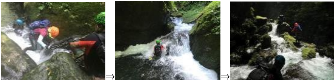
そこ登るの??マジ卍?!