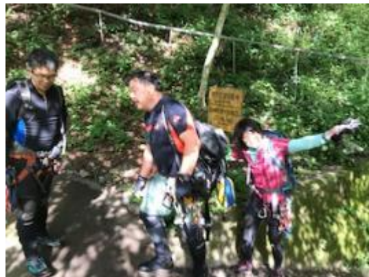
周遊完了～お疲れ様でした！