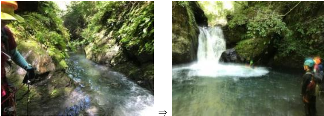
ザックピストンの講習場所

トラップでしょ～ww (橋) 押し流されるし冷たいの (涙) ひとつ突破しても、次々に現れる淵。狭く水量が多いので、泳ぐ泳ぐ・・ 流れがあるところでは、岩をつかんでへつったり、滝を登ってみたり・・ また比較的流れの緩い場所を利用して CL にザックピストンの方法を教えて頂 きました。大変 解りやすい説明でとても勉強になりました。CL 本当にありが とうございます。さっきはワクワクしちゃってゴメンなさい・・