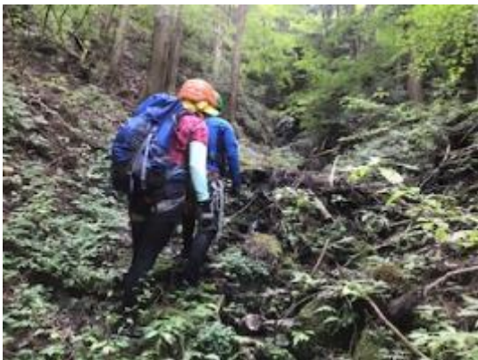
探勝路を探して・・・下山