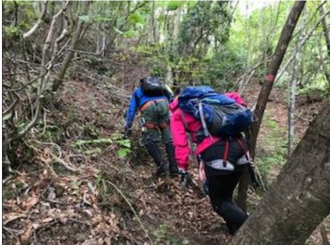
右岸より大滝を巻きます